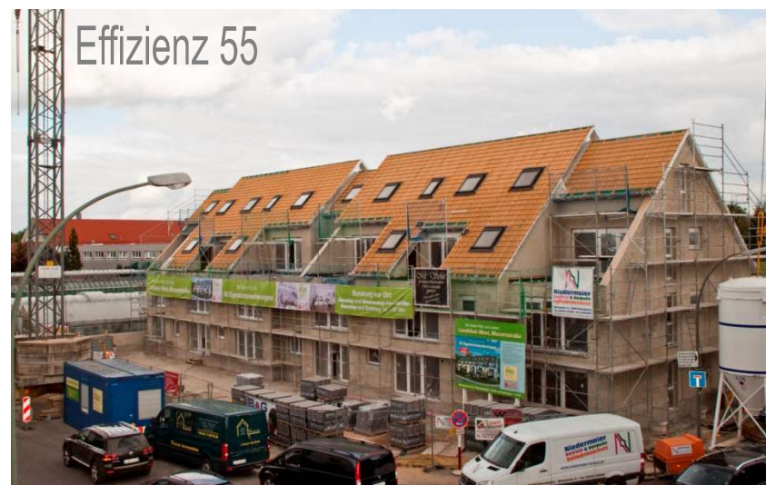
Wohnanlage Mozartstraße, Landshut-West MFH mit 18 Wohnungen, Fertigstellung 2012 Solarkollektoren für FBH und Brauchwasser Endenergiebedarf 25 kWh/(m 2 a)