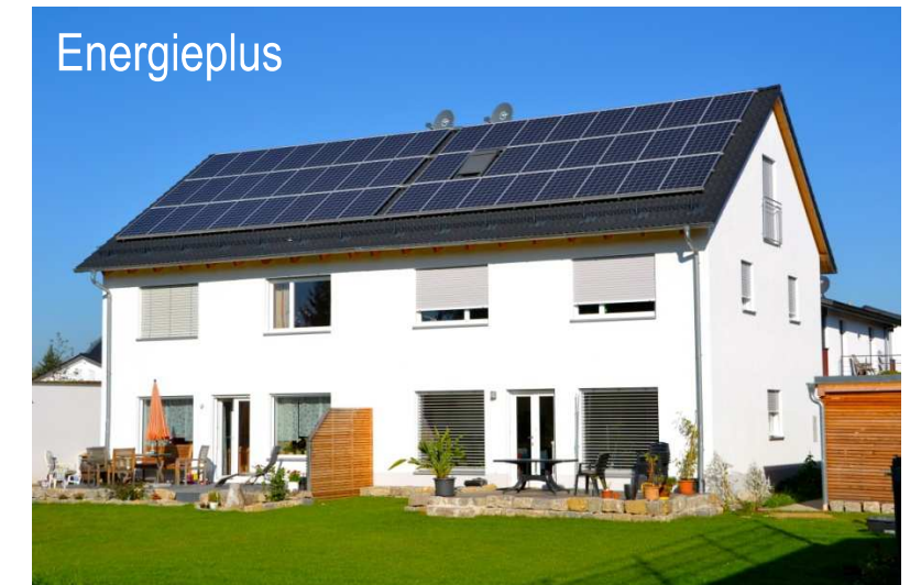
Doppelhaus Landshut Fertigstellung 2010, Erdkollektoren, Wärmepumpe, PV Endenergiebedarf 13 kWh/(m 2 a)