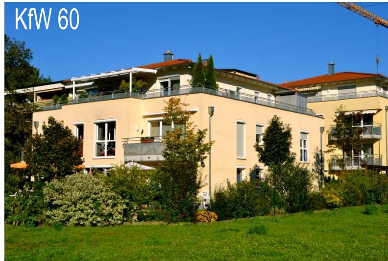
Villenduetz Ludmillastraße, Landshut 2 MFH mit 15 Wohnungen, Fertigstellung 2007 Gasbrennwerttechnik, Endenergiebedarf 58,1 kWh/(m 2 a)

der Firmengruppe EnergieEffizientes Bauen