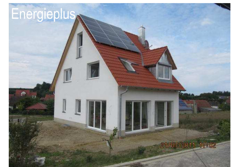
DHH Rohrbach bei Pfaffenhofen Fertigstellung 2011 Erdkollektoren, Wärmepumpe, PV Endenergiebedarf 14 kWh/(m 2 a)