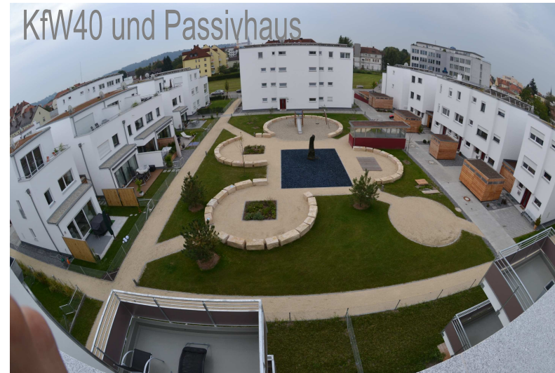
Ludmilla Wohnpark, Ludmillastraße, Landshut 13 EFH/RH/DH und 8 MFH mit 55 Wohnungen, Fertigstellung 2011 Erdkollektoren, BHKW, PV Endenergiebedarf z.B. EFH 11 kWh/(m 2 a)